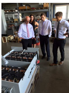
Посещение производственной площадки Pfenning Elektroanlagen GmbH в г. Ауб

Представитель Баварии в РФ посетил 19 июля 2016 г. Вюрцбург по приглашению расположенной в этом городе юридической компании Fraas & Partner, уже в течение многих лет оказывающей поддержку своим клиентам в развитии деловых связей с партнерами за рубежом.