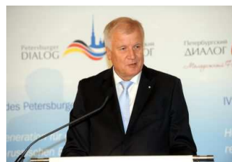
Премьер-министр Баварии Х.Зеехофер на открытии форума.

С приветствием к участникам форума обратился Премьер-министр Баварии Х.Зеехофер. Молодежный форум, созданный по образцу форума «Петербургский диалог», дает молодым людям из России и Германии возможность обсуждения актуальных тем в сфере двустороннего сотрудничества, а также служит в качестве платформы для укрепления взаимопонимания гражданских обществ обеих стран.